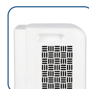
Uchwyty do przenoszenia

Urządzenie łączące funkcje osuszacza i oczyszczacza powietrza, wykorzystuje filtry z katechiny, jonów srebra i antybakteryjne, gwarantując czyste powietrze. Jego stylizowany design i całkowicie biały kolor nadają elegancki wygląd, a przyjazny dla środowiska czynnik chłodzący R290 podkreśla ekologiczne zaangażowanie producenta. Idealne do nowoczesnych wnętrz, łączy wysoką wydajność z łatwością użytkowania.