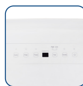
Kontrola cyfrowa i wyświetlacz LED